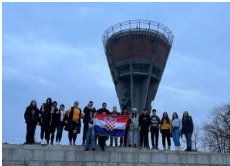
Slika 30: Posjet učenika 8. razreda gradu heroju - Vukovar