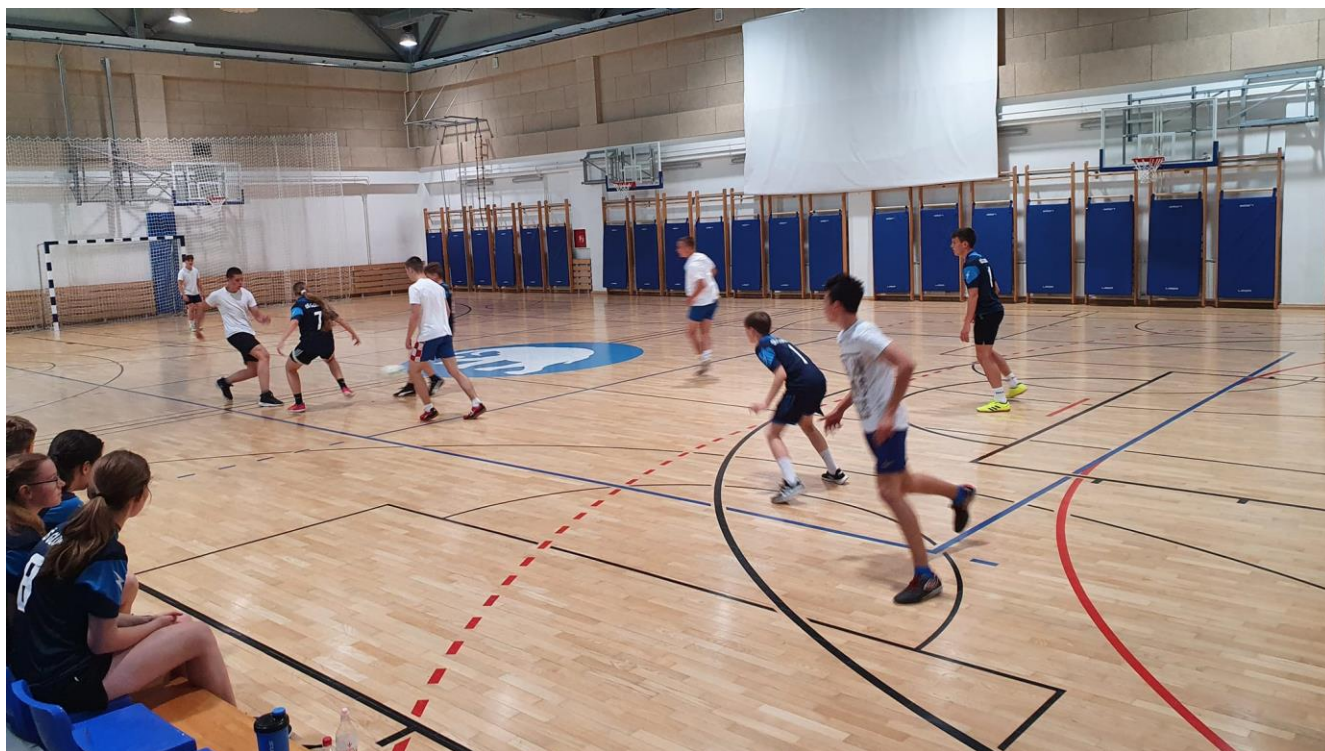
Slika 22: Momčad futsala