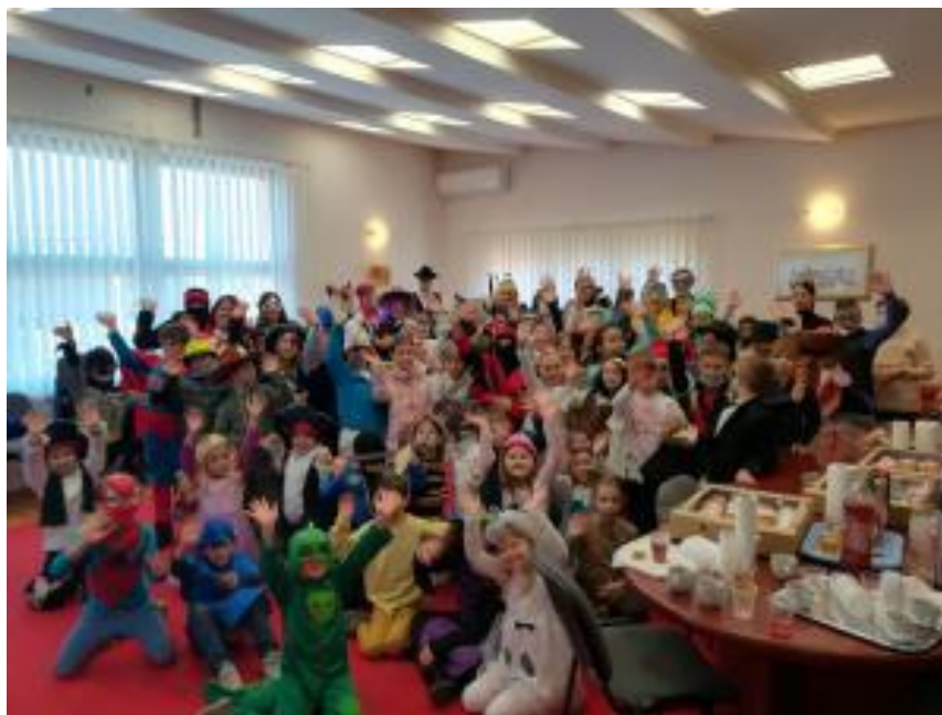
Slika 43: Maškare u školi