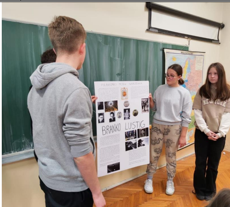
Slika 55: Dan sjećanje na holokaust