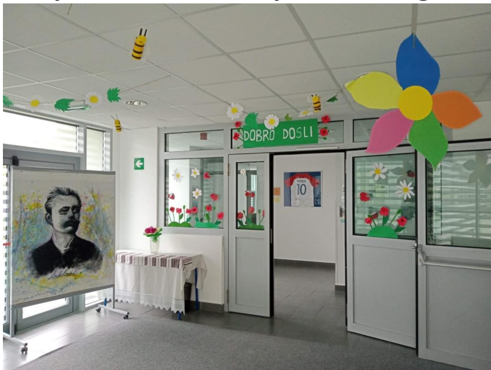
Slika 1: Ulaz u školu