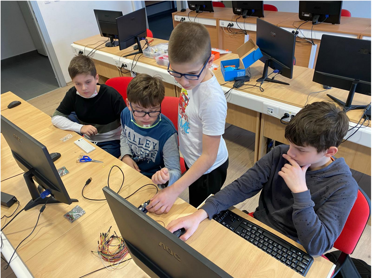
Slika 20: Mladi informatičari