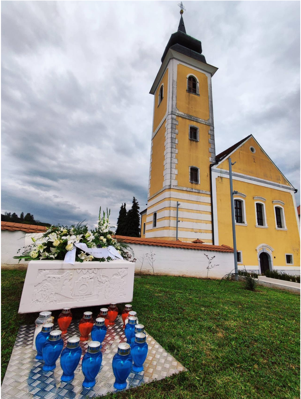
Slika 36: Dan sjećanja 22. rujna