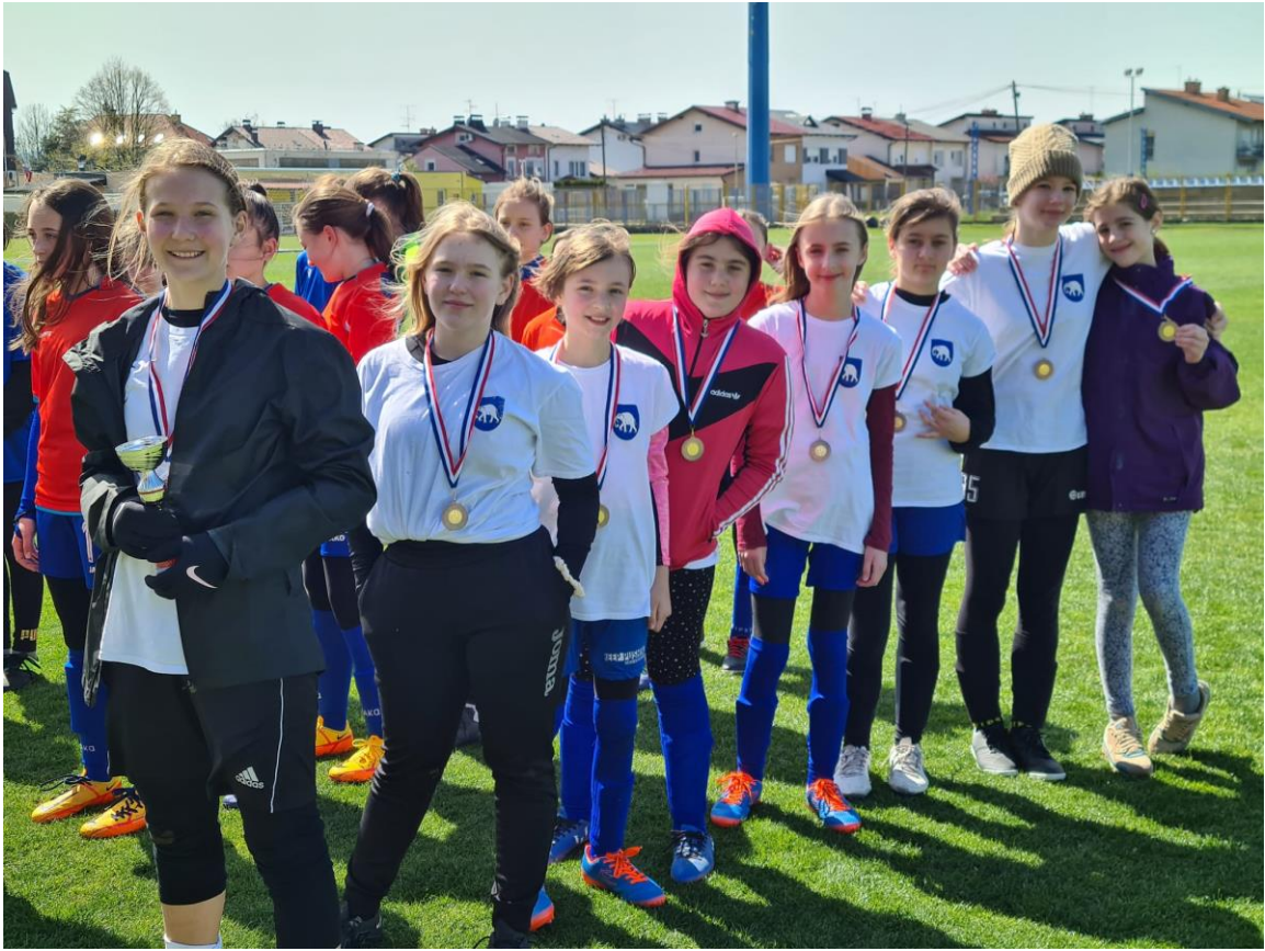
Slika 12: Sportska skupina