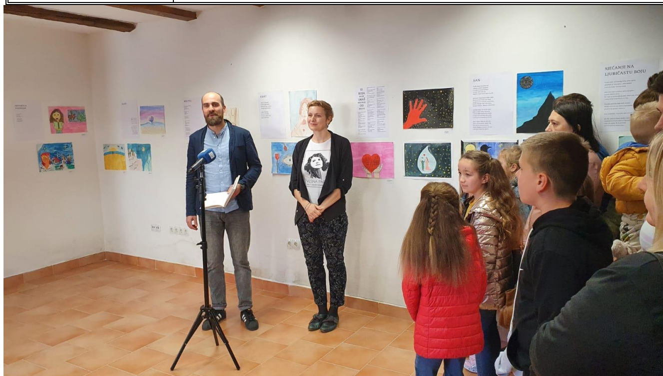
Slika 25: Noć knjige