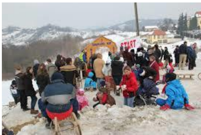
Slika 72: Sanjkaški kup u Mariji Gorici