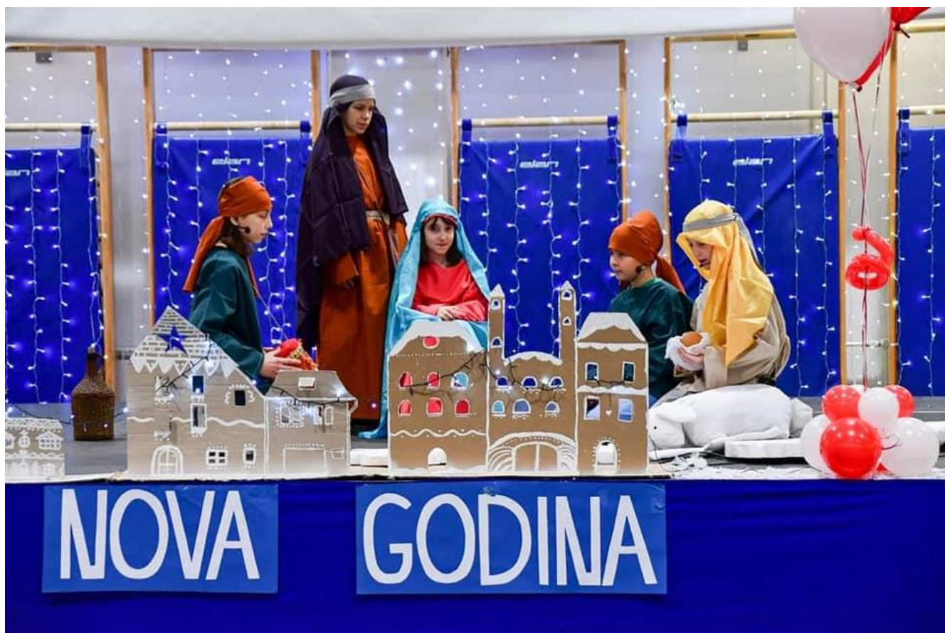
Slika 41: Božićni sajam