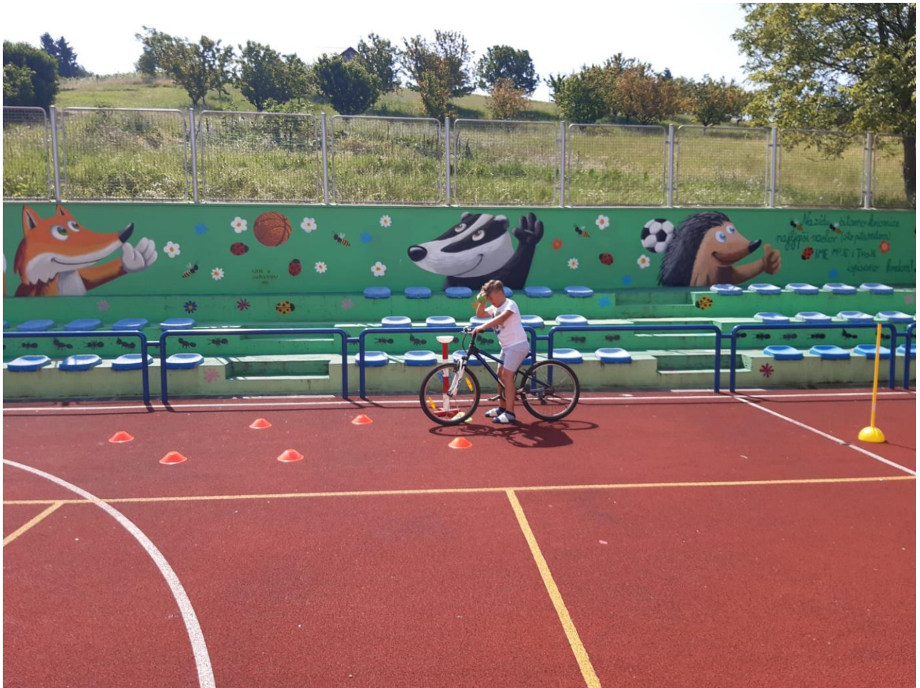
Slika 68: Program osposobljavanja za upravljanje biciklom