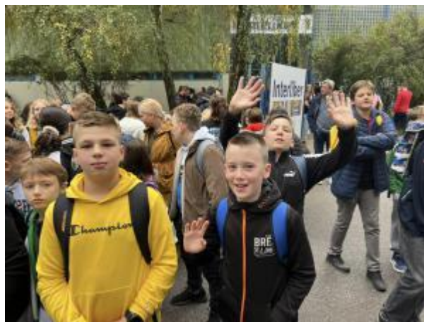
Slika 31: Posjet Interliberu