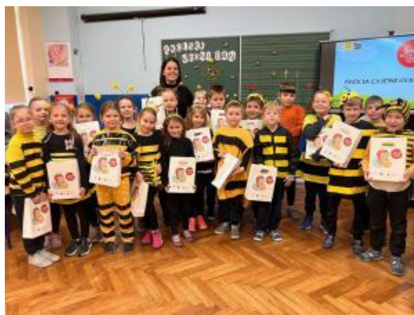
Slika 71: Medni dan