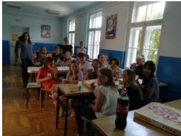
Slika 14: Novinarska skupina