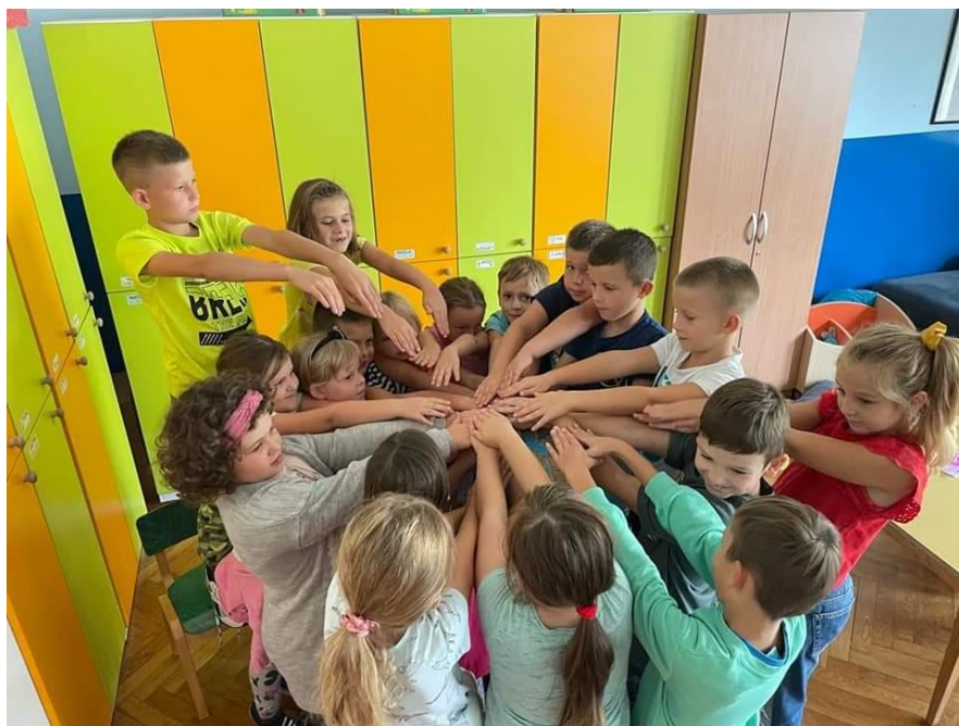
Slika 69: Budi mi prijatelj