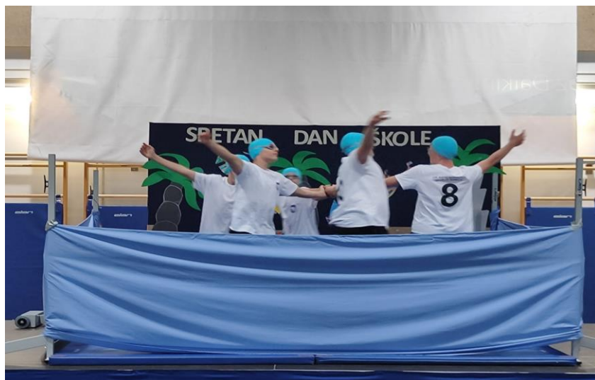
Slika 15: Dramsko-kreativna radionica