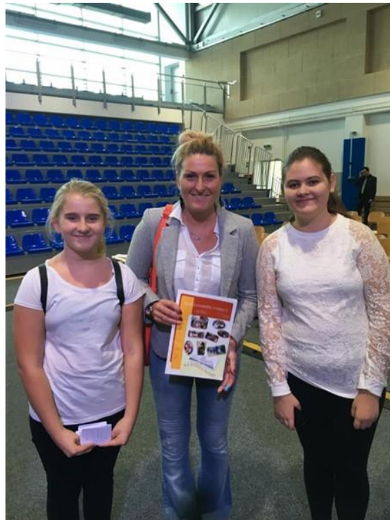
Slika 40: Susret s hrvatskom olimpijkom Janicom Kostelić prigodom otvorenja sportske dvorane 2016. godine