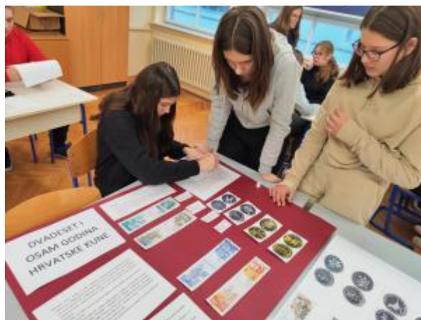
Slika 23: Povijesna grupa