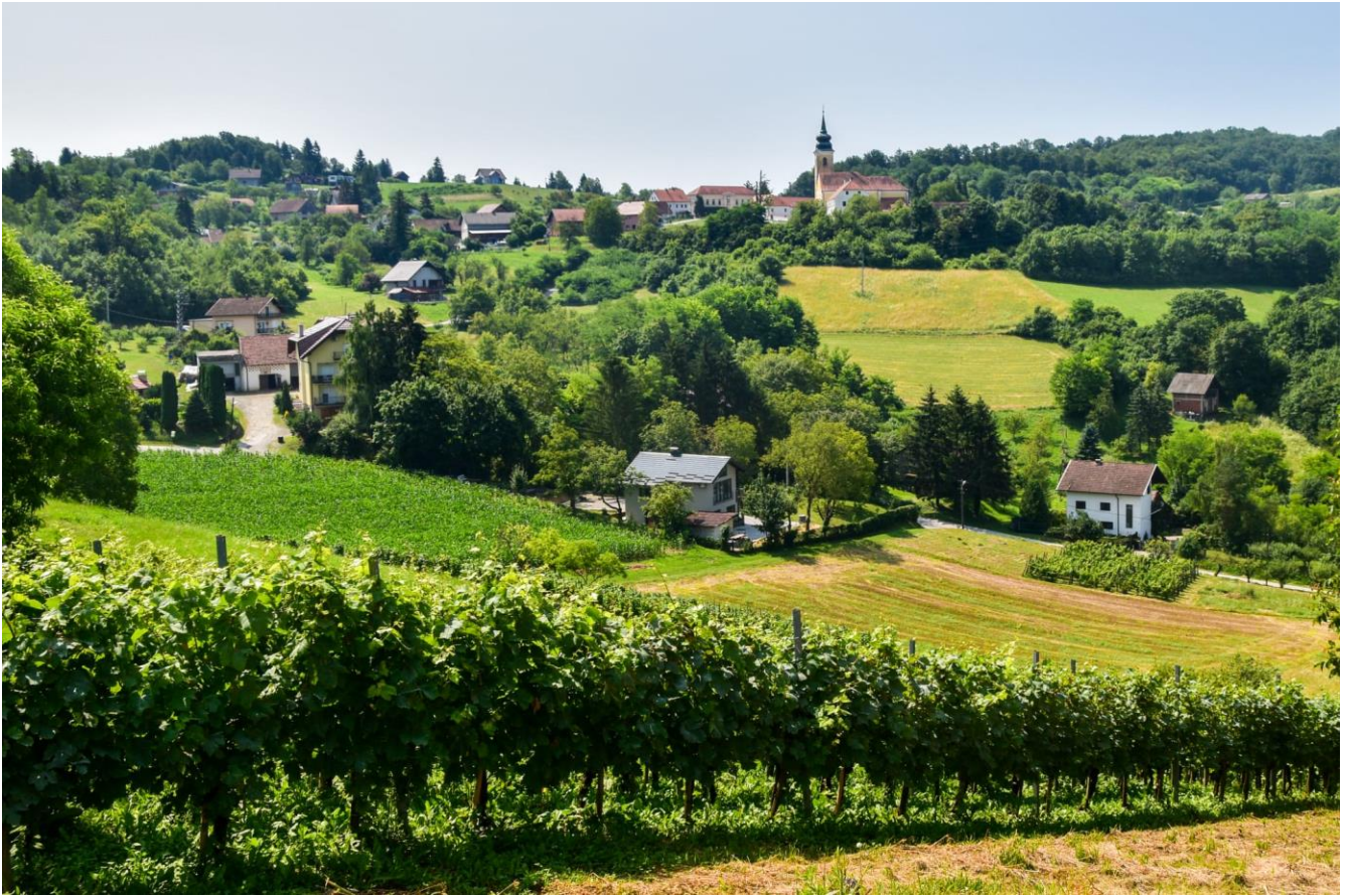
Slika 29: Naše mjesto