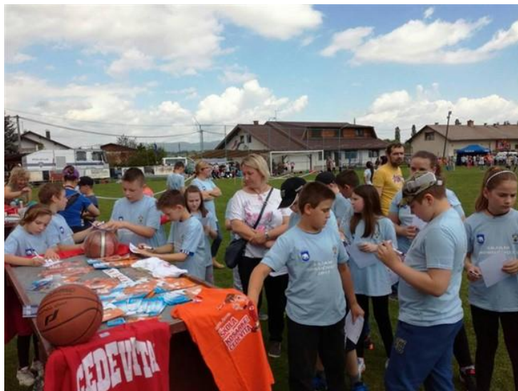
Slika 26: Sajam mogućnosti