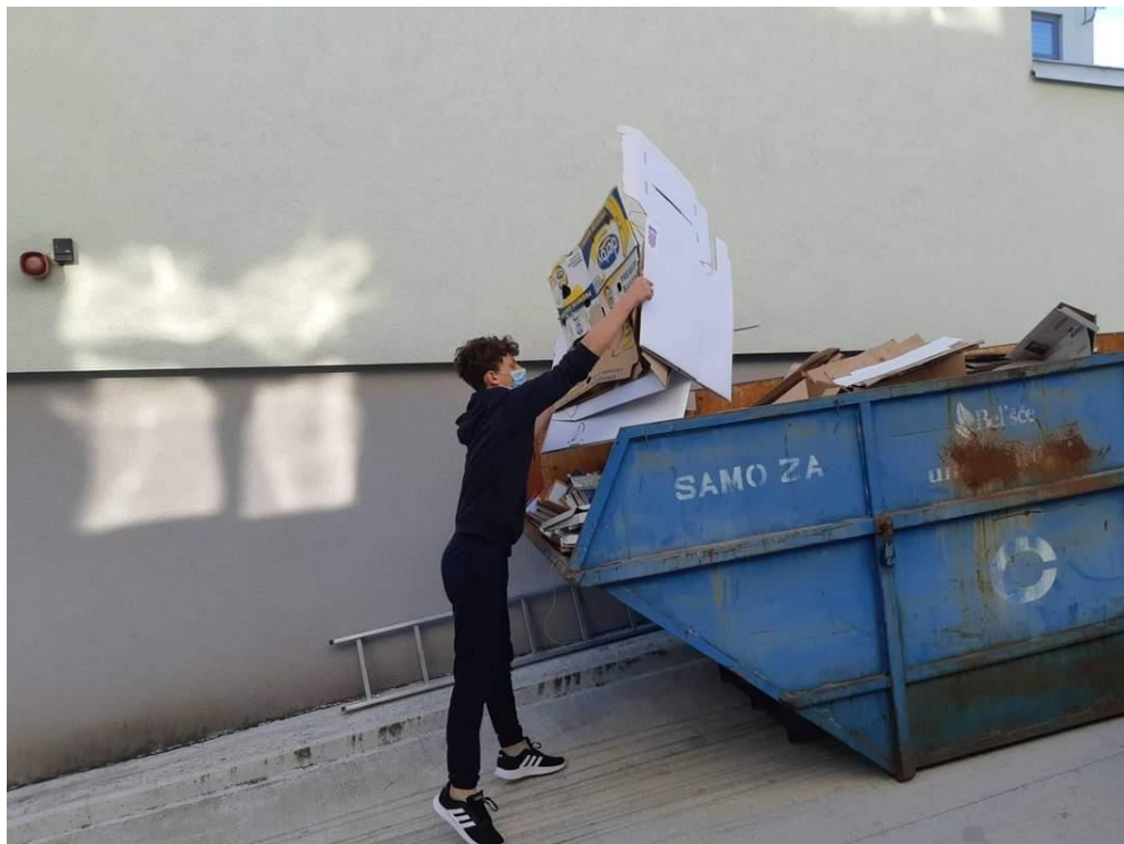
Slika 51: Skupljanje starog papira