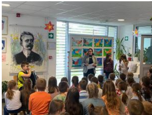
Slika 18: Glazbena radionica