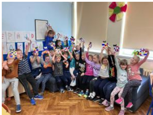
Slika 70: Dan jabuka