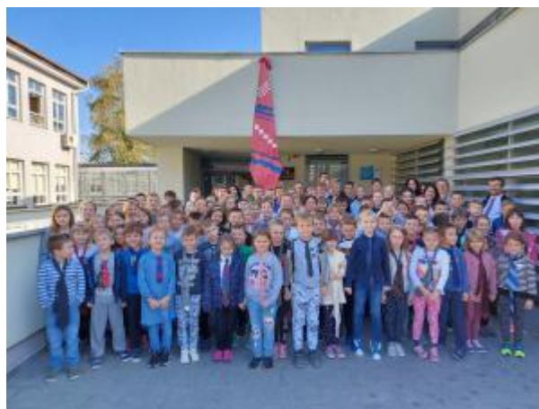
Slika 59: Dan kravate