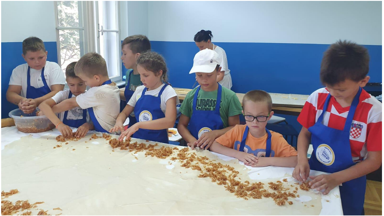
Slika 11: Domaćinstvo