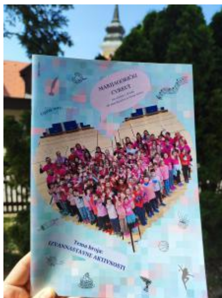
Slika 3: Školski list Marijagorički cvrčci