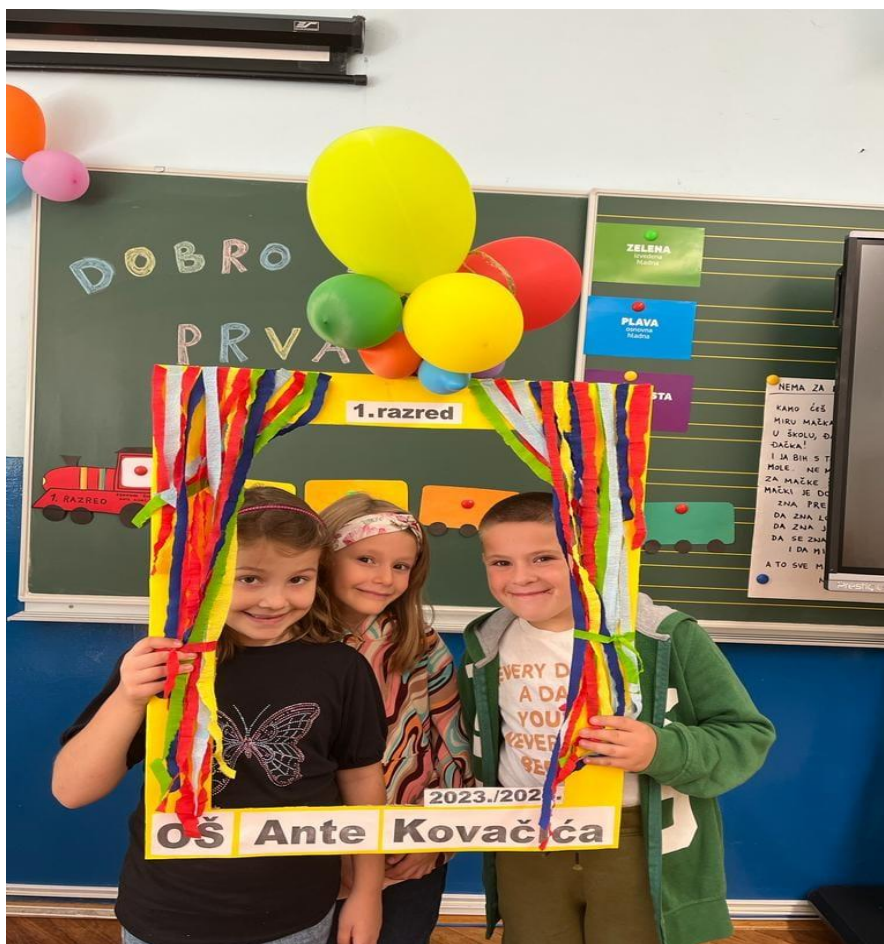
Slika 9: Dobro nam, došli prvašići!