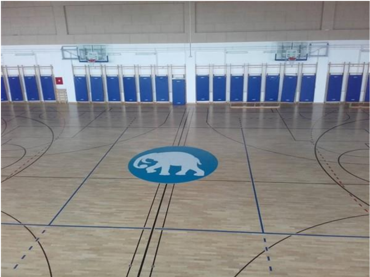
Slika 2: Sportska dvorana

Sportska dvorana svečano je otvorena 29. rujna 2016. godine