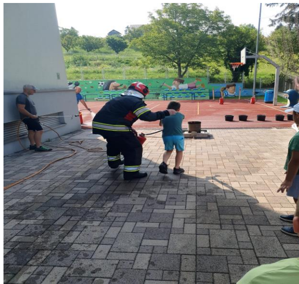
Slika 66: Projekt „Ljeto u Mariji Gorici“