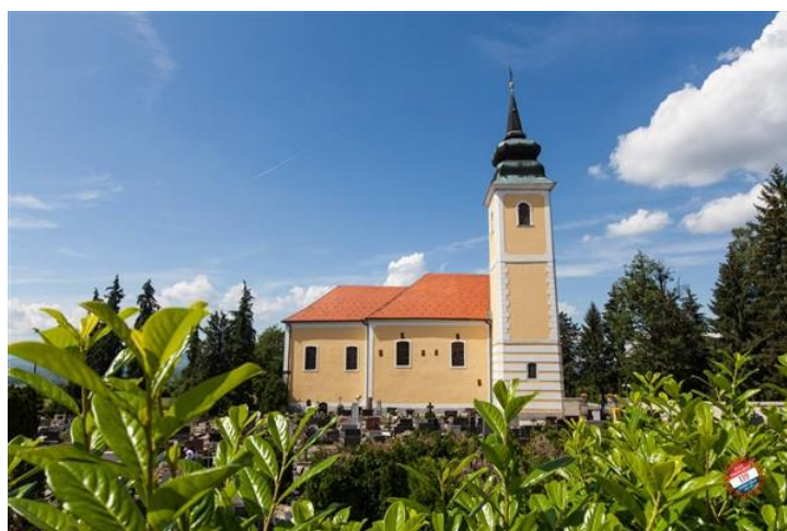
Slika 33: Župna crkva BDM od Pohođenja