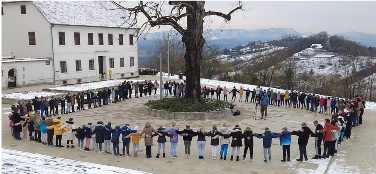
Slika 28: Igre na snijegu