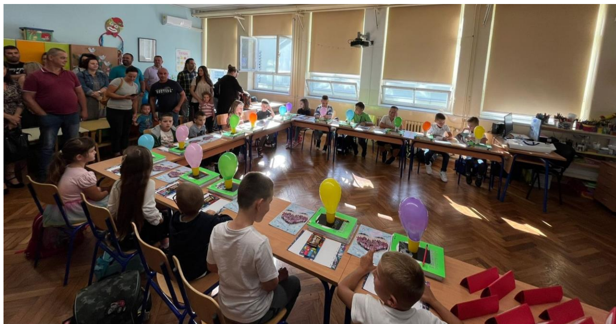
Slika 10: Učionica 1. razrednog odjela