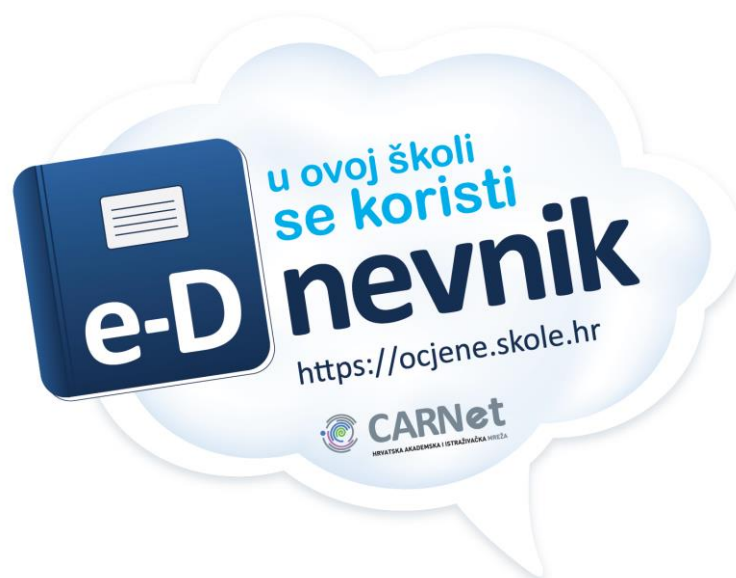
Slika 5: