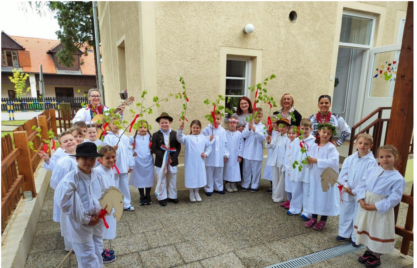
Slika 38: Jurjevo