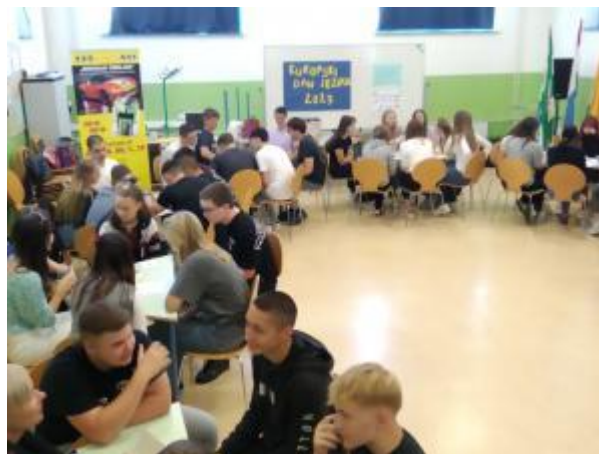
Slika 48: Europski dan jezika