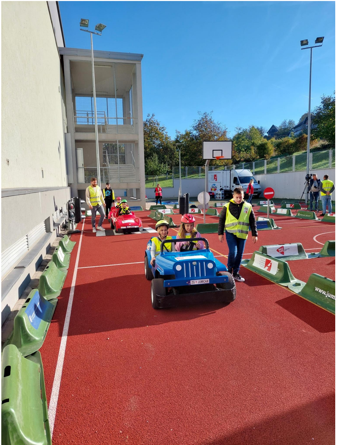
Slika 67: Prometna kultura Jumikar