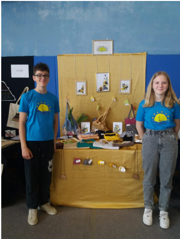
Slika 21: Školska zadruga "Sunce"