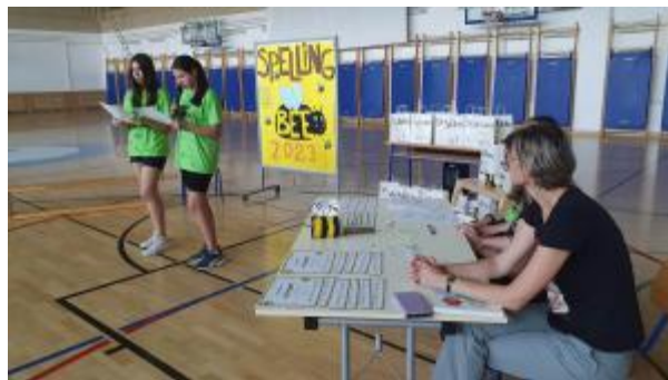
Slika 63: Spelling Bee