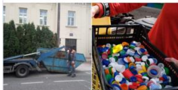
Slika 49: Humanitarne aktivnosti