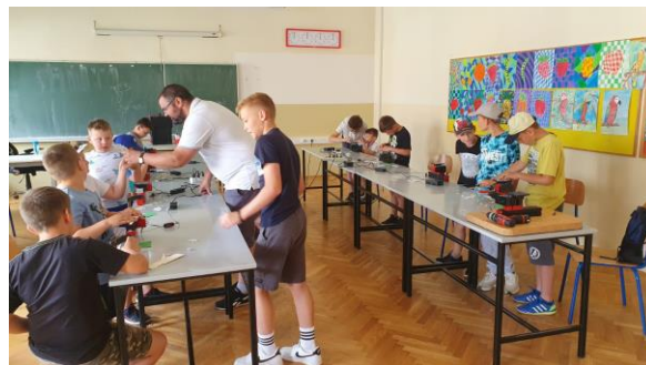
Slika 19: Klub mladih tehničara