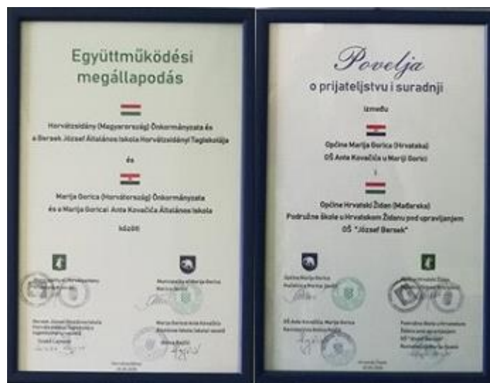
Slika 46: Suradnja s OŠ u Hrvatskom Židanu