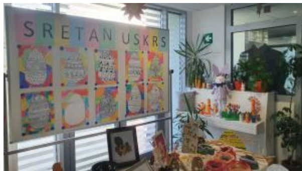
Slika 42: Gorička pisanica