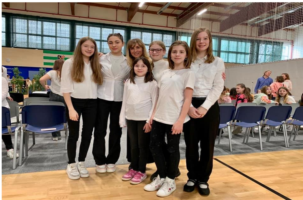
Slika 17: Školski zbor