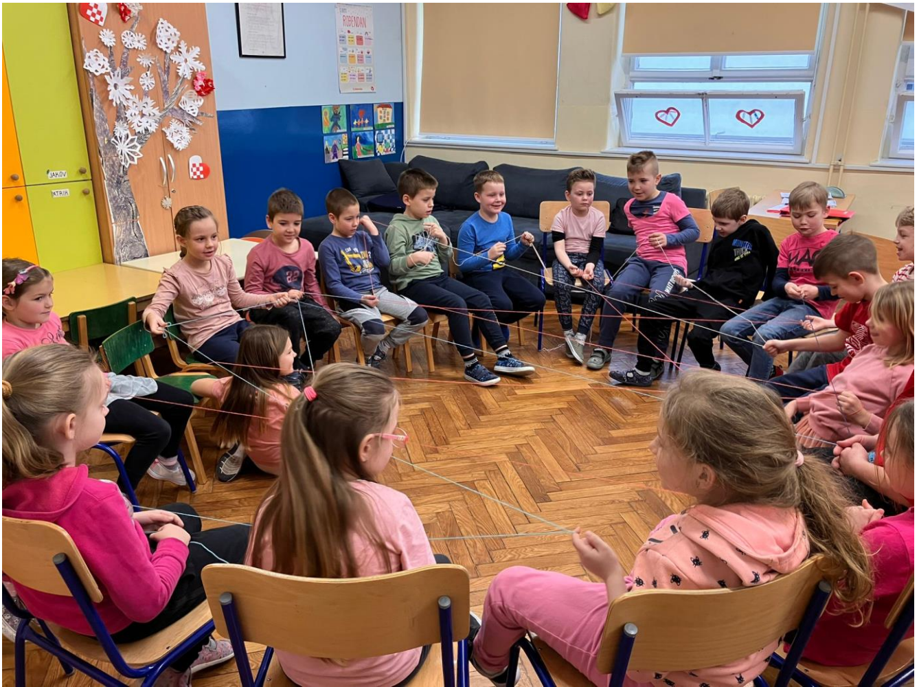
Slika 45: Dan ružičastih majica