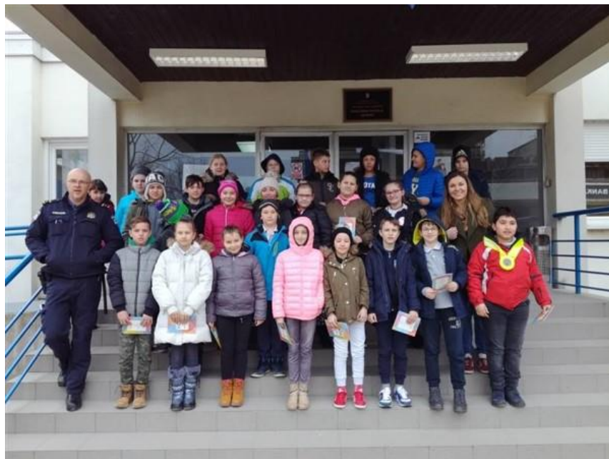
Slika 58: MAH 1