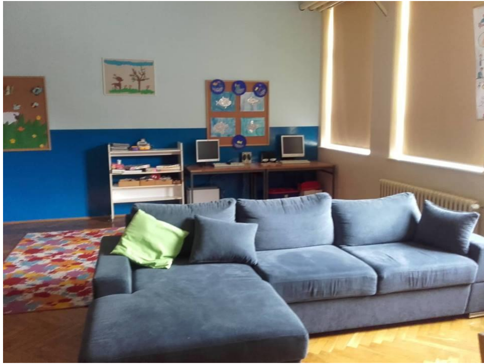
Slika 76: Učionica produženog boravka