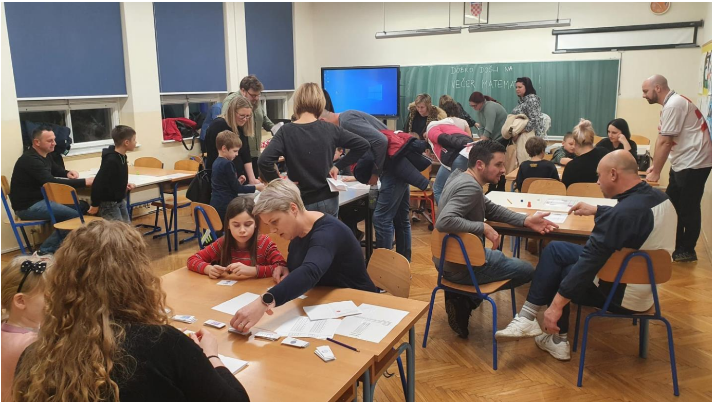
Slika 60: Večer matematike