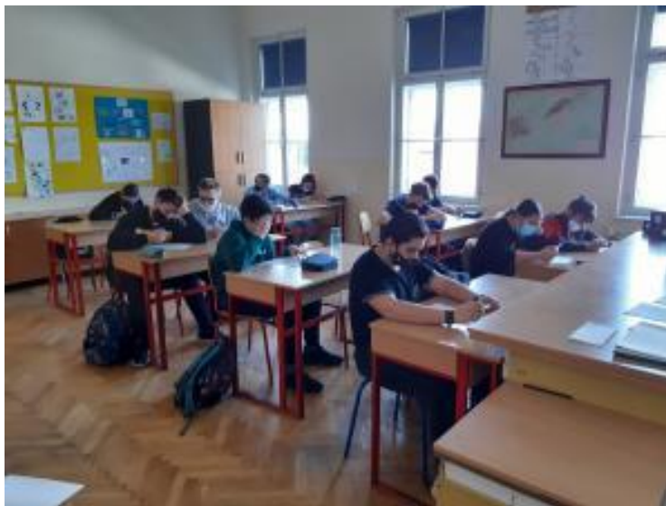
Slika 75: Profesionalno informiranje i usmjeravanje učenika