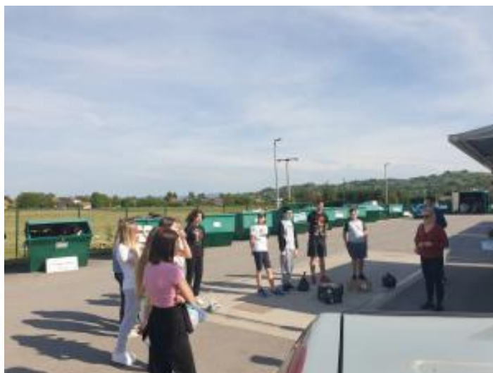
Slika 32: Posjet reciklažnom dvorištu