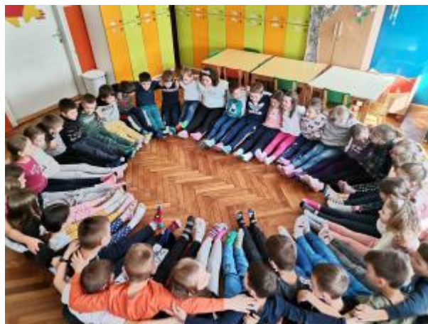
Slika 53: Dan šarenih čarapa