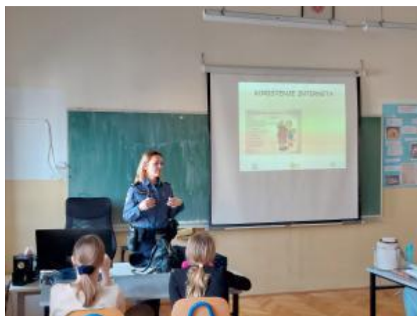
Slika 44: Prevencija zlouporabe sredstava ovisnosti