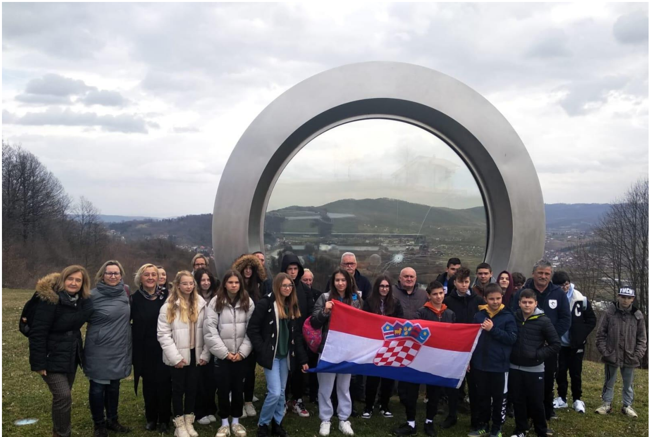
Slika 57: Motivacijske priče iz Domovinskog rata