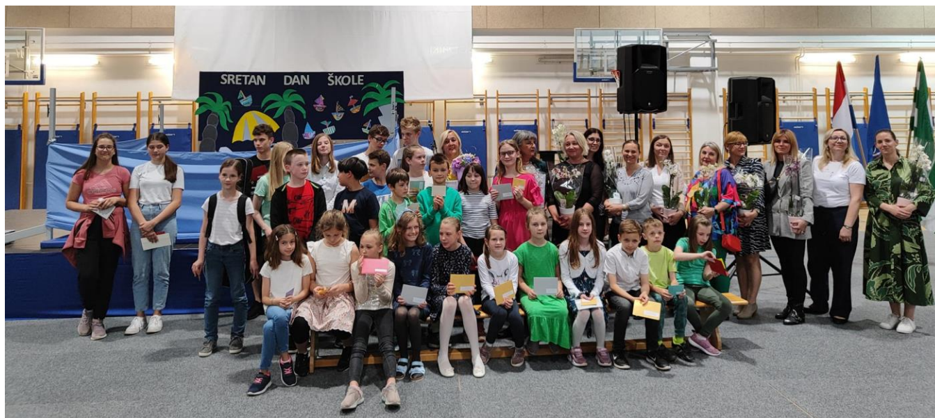
Slika 35: Dan škole