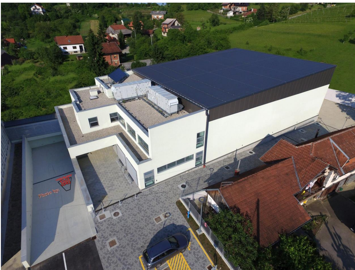
Slika 73: Sportska dvorana u Mariji Gorici