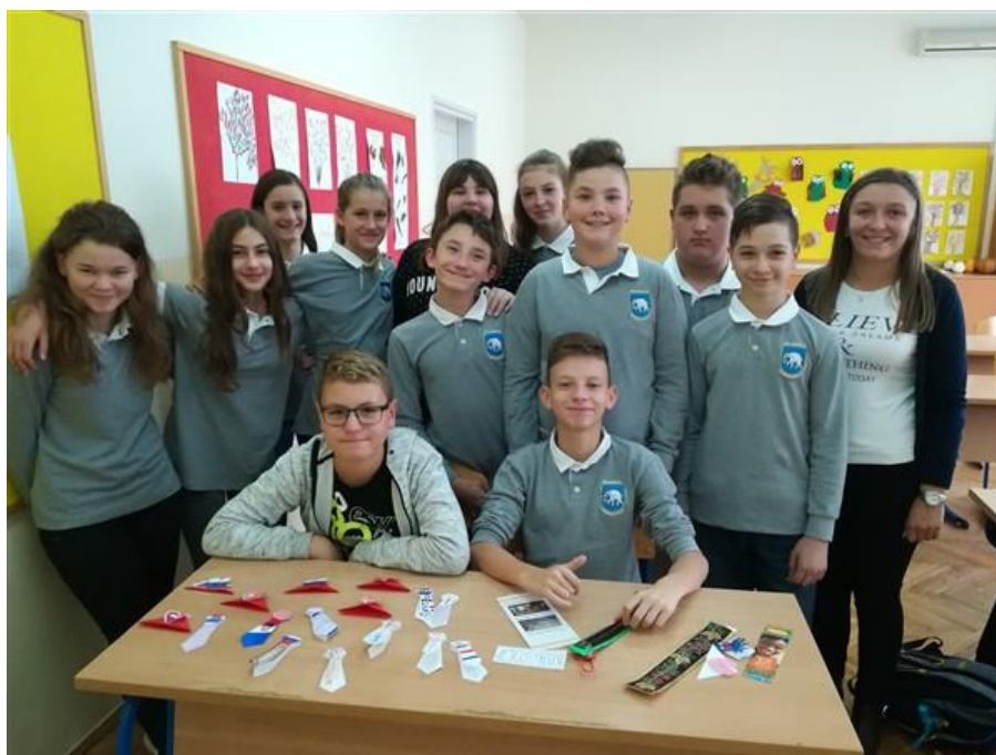
Slika 64: Razmjena straničnika