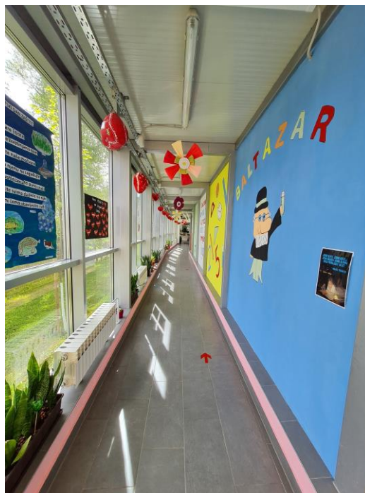
Slika 16: Estetsko uređenje škole