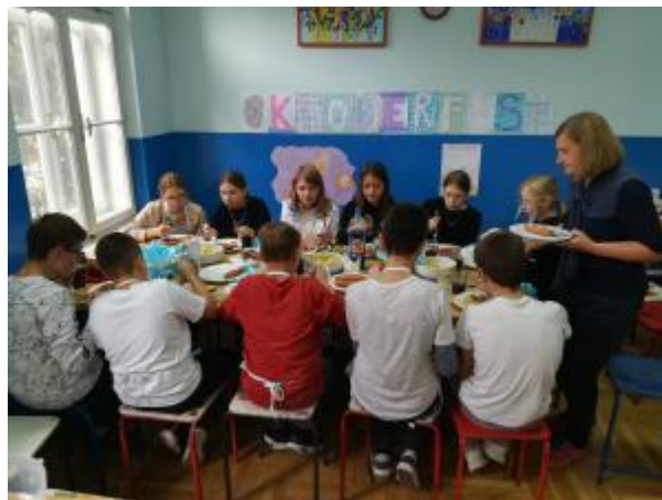
Slika 34: Njemački jezi