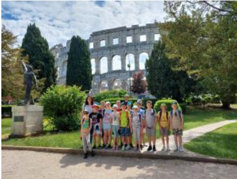
Slika 27: Škola u prirodi