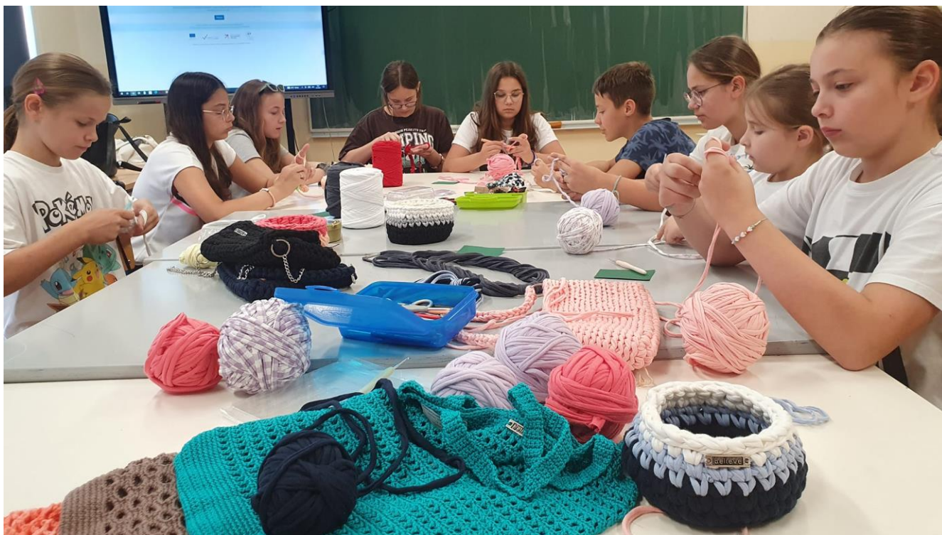
Slika 7: Projekt "Ljeto u Mariji Gorici" – mi živimo "Školu za život"