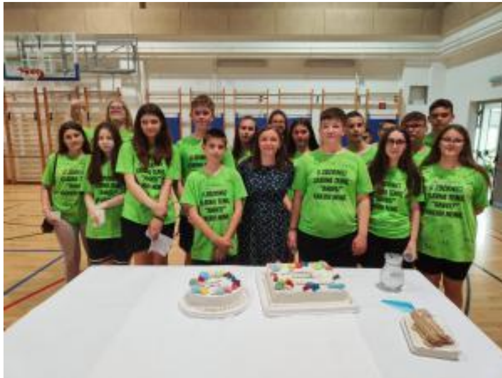
Slika 47: Doviđenja osmaši