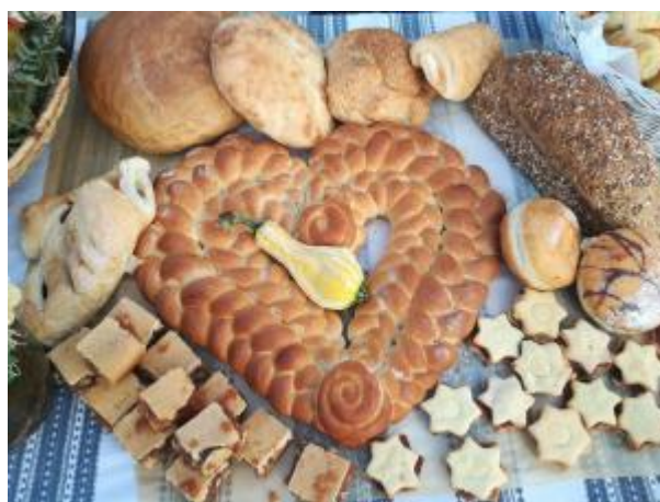
Slika 37: Dani kruha i zahvalnosti za plodove zemlje