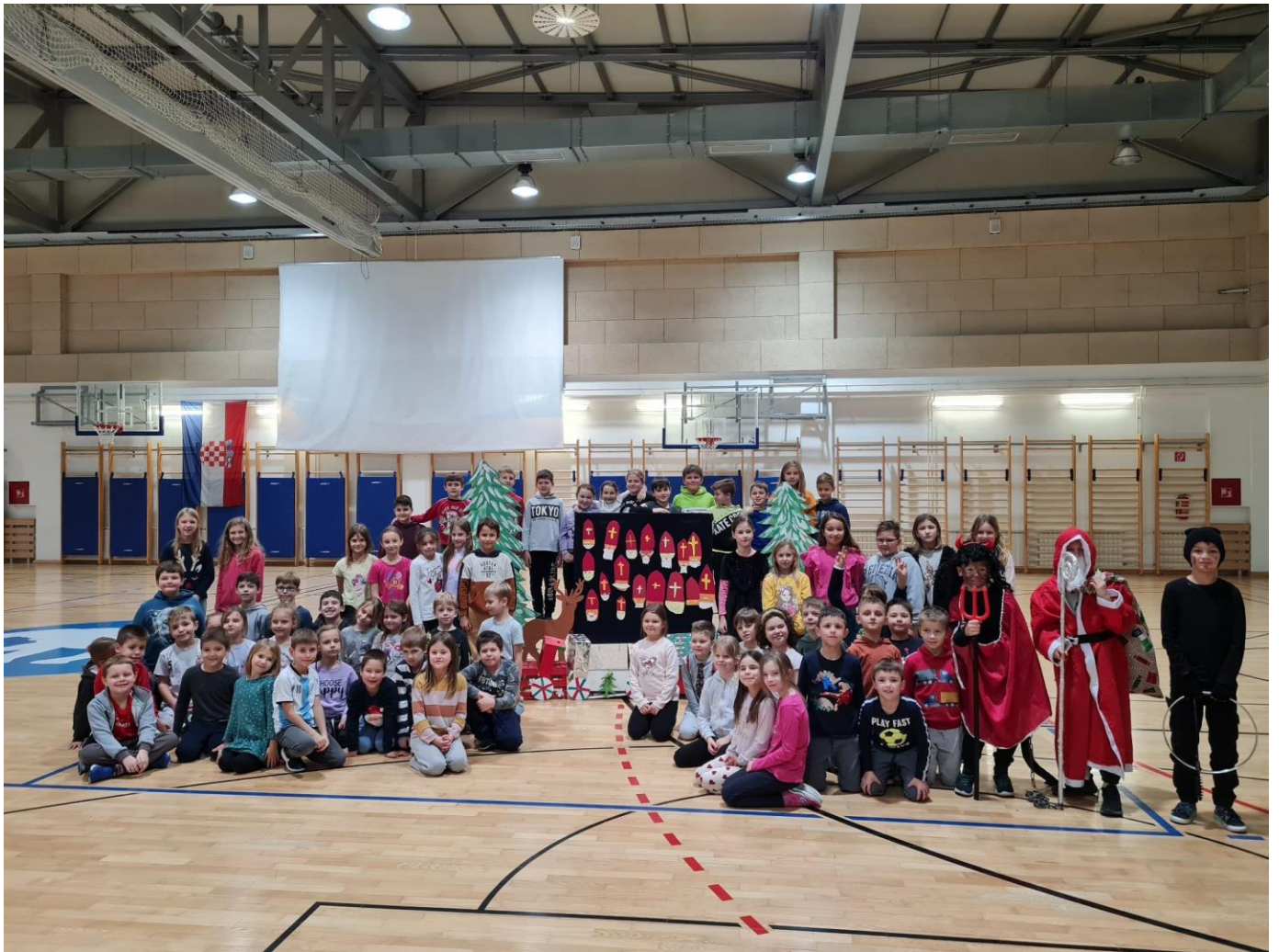
Slika 39: Obilježavanje blagdana sv. Nikole