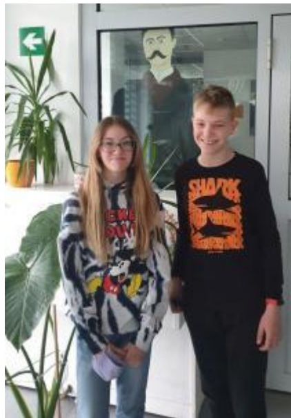
Slika 62: "Hippo" - engleski bez granica