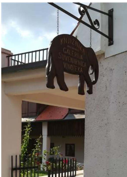
Slika 24: Općinska knjižnica Ante Kovačića u Mariji Gorici