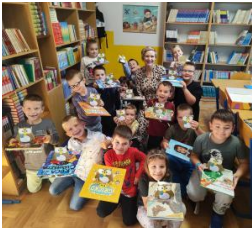
Slika 8: U školskoj knjižnici