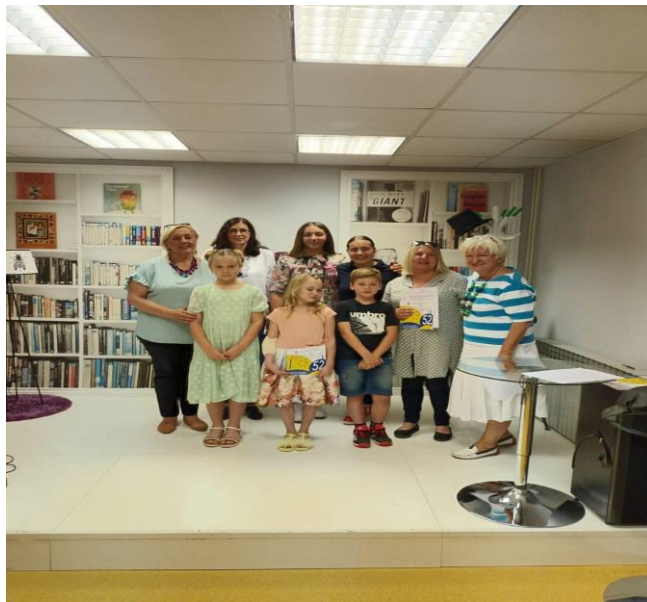
Slika 13: Literarna skupina