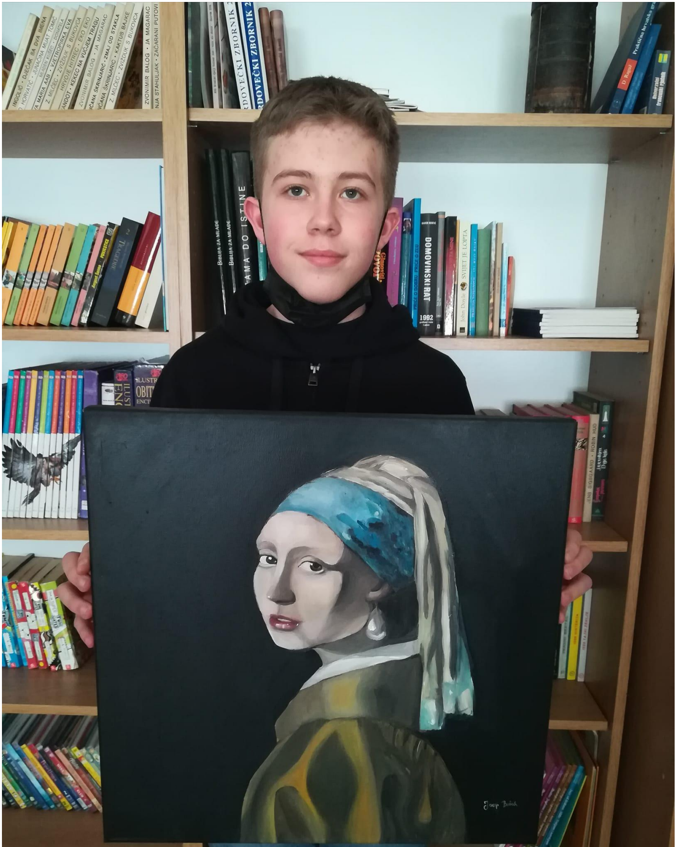
Slika 65: Daroviti učenici