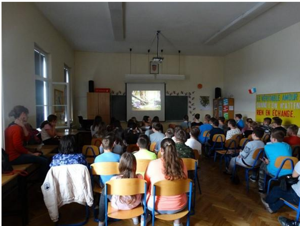
Slika 52: Europski dan