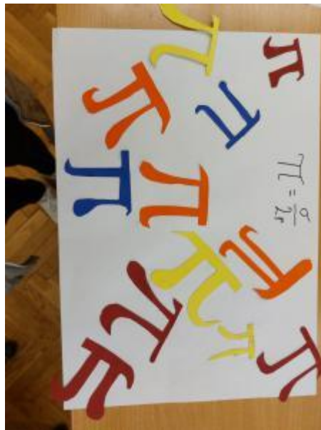
Slika 61: Dan broja Pi