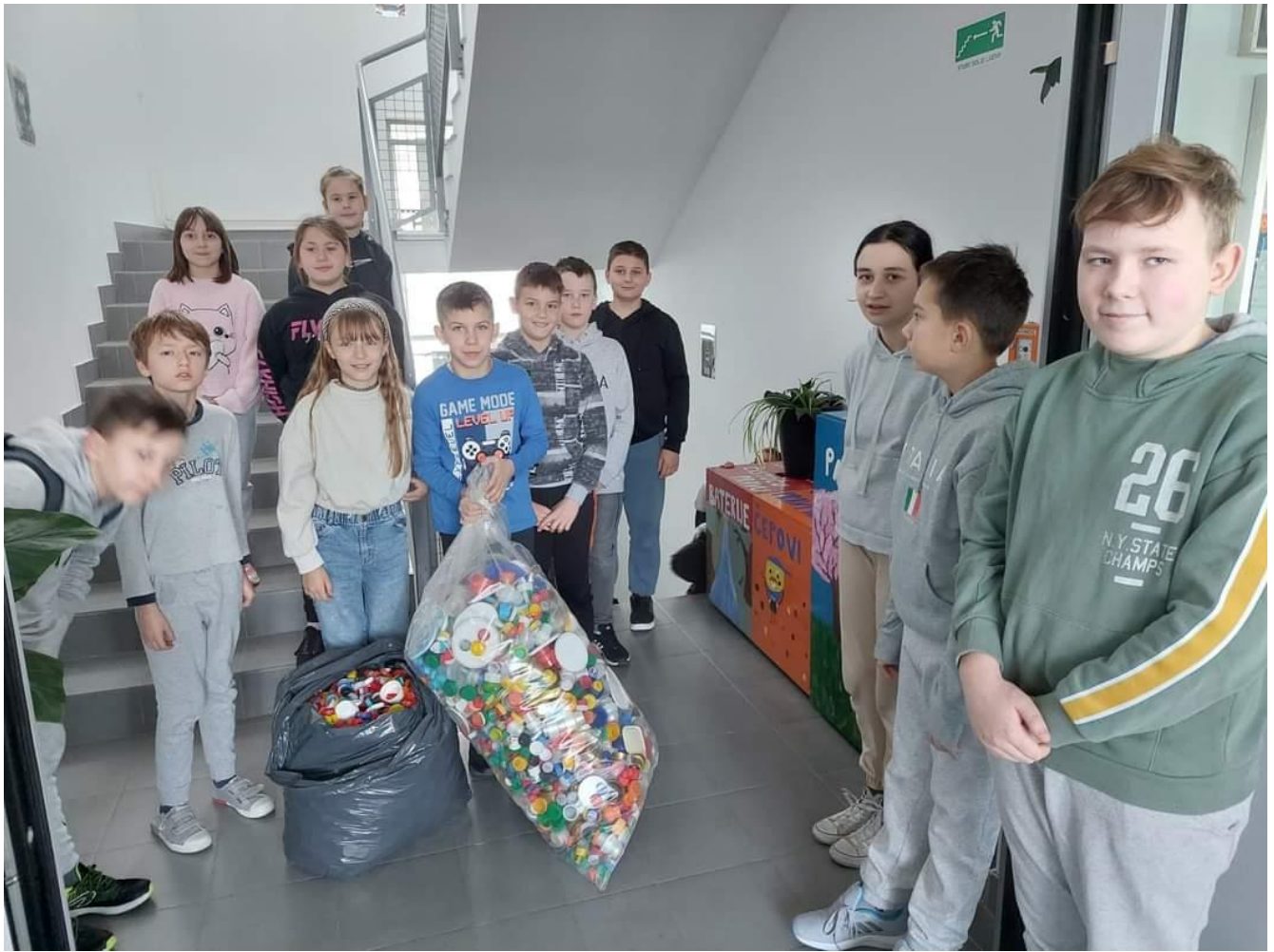
Slika 50: Plastičnim čepovima do skupih lijekova