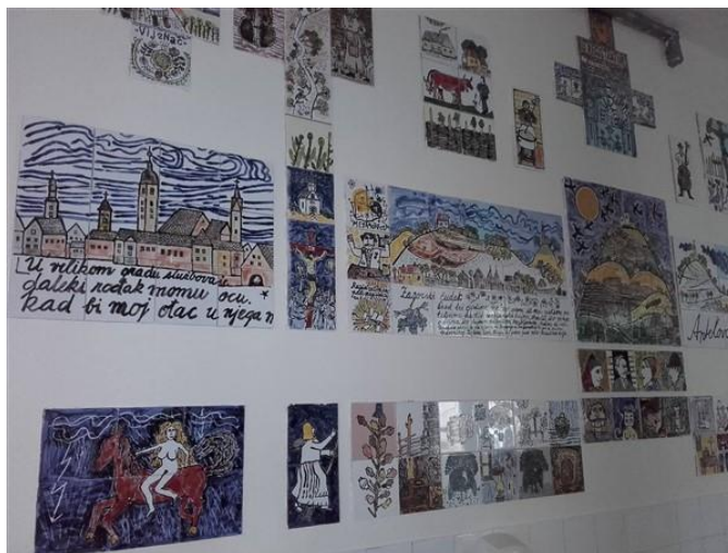
Slika 6: Keramički ostvaraji s motivima iz književnih djela Ante Kovačića

Školski kurikul je plan na čiju realizaciju utječu brojni čimbenici koje u fazi donošenja kurikula ne možemo sve predvidjeti te pri realizaciji ovog kurikula može doći do prilagodbe planiranih aktivnosti ili otkazivanja planiranog.