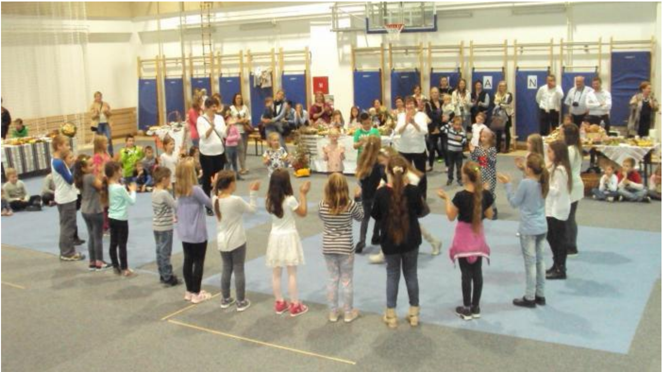
Slika 77: Vizija naše škole je odgoj i obrazovanje uspješnih i zadovoljnih učenika koji će prema vlastitim sposobnostima i interesima biti pripremljeni za daljnje srednjoškolsko obrazovanje, cjeloživotno učenje i osobni razvoj na tržištu rada.