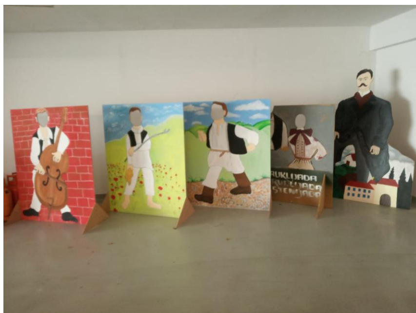
Slika 4: Iz djela U registraturi, Ante Kovačića